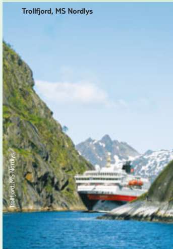
Trollfjord, MS Nordlys